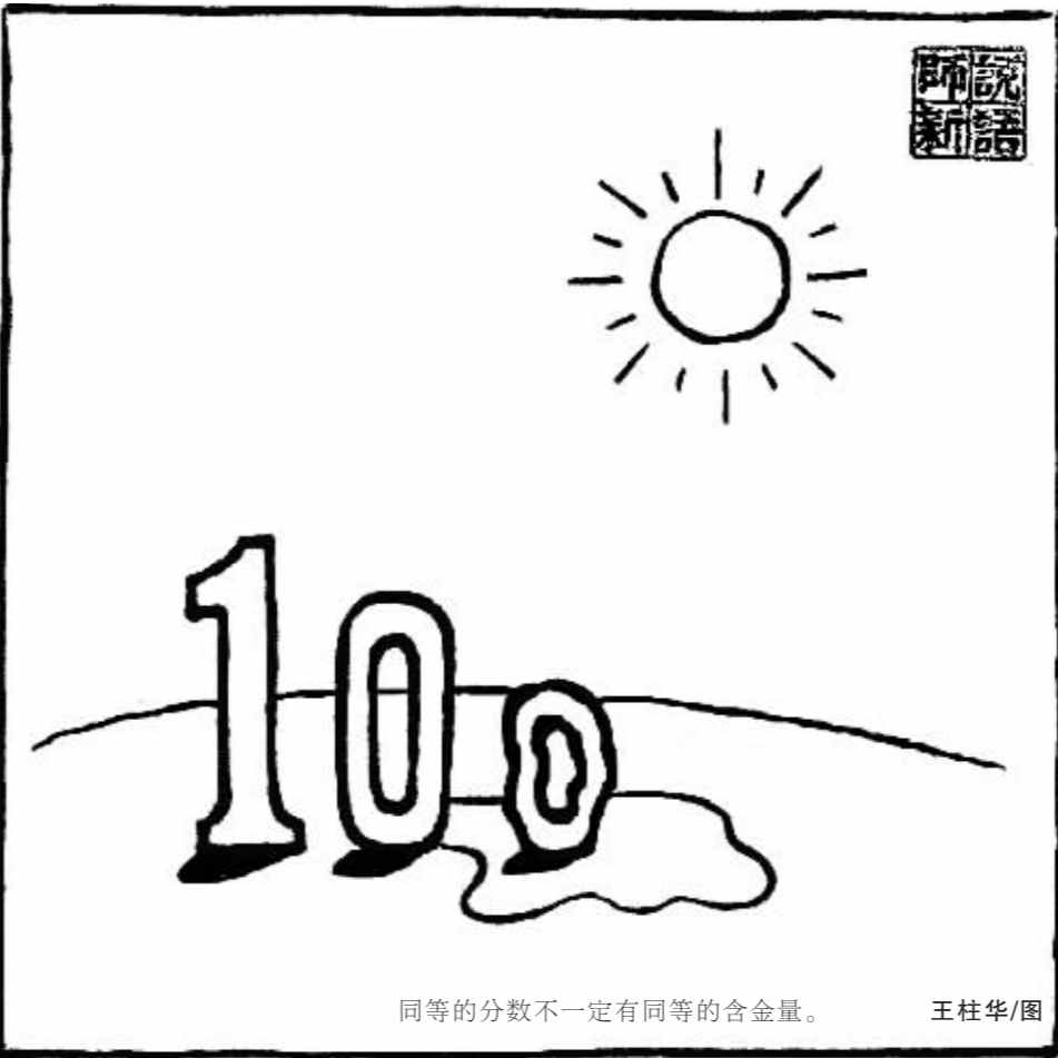
同等的分数不一定有同等的含金量。