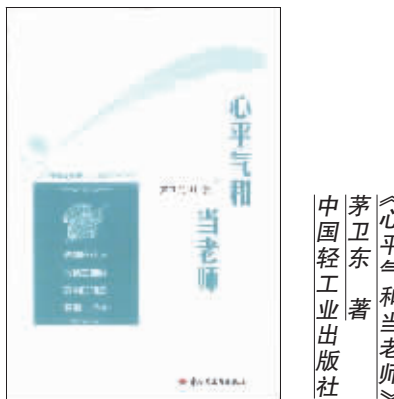
《心平气和当老师》 茅卫东 著 中国轻工业出版社