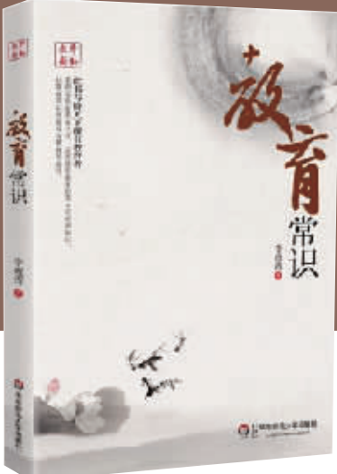
《教育常识》李政涛 著 华东师范大学出版社

李政涛,江西大余人,华东师范大学教授、博士生导师。现任中国中青年教育理论工作者分会副理事长、中国教育基本理论专业委员会副主任委员、华东师范大学基础教育研究中心主任。《教育常识》一书入选本报2012年度教育图书价值榜。