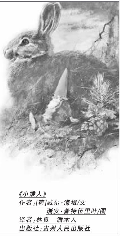
《小矮人》 作者：[荷]威尔·海根/文 瑞安·普特伍里叶/图 译者：林良 潘木人 出版社：贵州人民出版社

知道小矮人比我们强壮7倍吗？知道他们的嗅觉比我们灵敏19倍吗？知道小矮人无论见面告别都要行碰鼻礼吗？知道一对小矮人永远只生两个小孩吗？西方民间传说中的“小矮人”，是一种神奇的生灵。他们身高还不如一枝中国毛笔高。除了“小”以外，他们的生理构造跟人类几乎完全一样，而且比人类有更高的智慧。