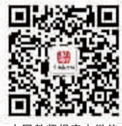
中国教师报官方微信

4 留守儿童教育,也可以这样做 湖南省龙山县三元乡九年制学校推行的“集体大走访”活动告诉我们,留守儿童教育也可以这样做。 《教师工作周刊》