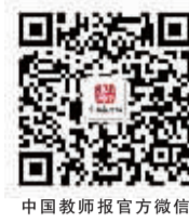
中国教师报官方微信

14 “家长上学”当家长不给力,教育怎么办? 辽宁省铁岭市为家长办学校,实现家校共赢。 《区域教育周刊》