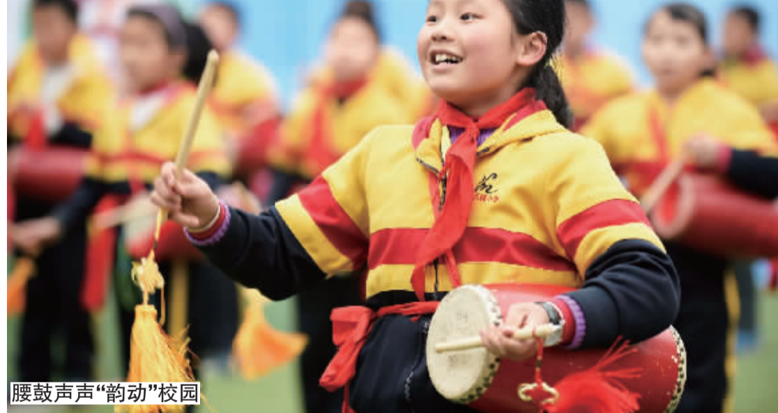
腰鼓声声“韵动”校园

12月9日，合肥市瑶海区第55中学琥珀名城学校举行第四届校园腰鼓文化艺术节，近3000多名学生参与打腰鼓展演。这所学校不仅设有腰鼓工作室、鼓文化教室，还编写了鼓文化教材，开设了腰鼓培训课，把腰鼓文化融进了教育的每一个细节。